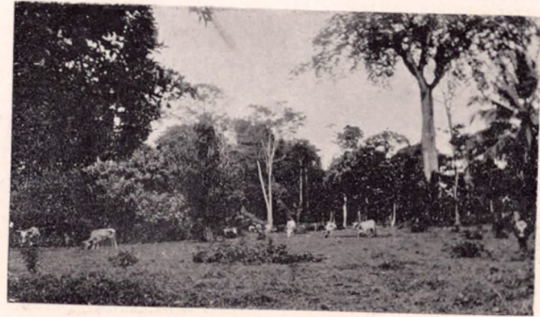
Hacienda de Hudgson en la región de Sixola

La corona de Talamanca se transmite por herencia y por conducto de las mujeres: es el hijo, y con preferencia la hija si la hay, de la hermana del rey, quien