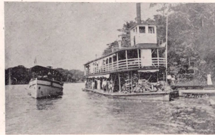
Buques bananeros en el Río Sixola