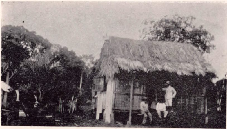
Uno de los palacios en que fué recibido el Dr. Porras durante su expedición

Uren ya no se llama Sixaola sino Tilirí. (1) No hay que olvidar que vamos remontando. El valle de Talamanca se abre aquí en anchos llanos. En lontananza se divisan altas cordilleras de formas extrañas, y más sobresaliente el Pico Blanco, á 12,000 pies sobre el nivel del mar, en dirección S. S. O. El Larí se comunica por brazos con el Tilirí. Llegamos al punto en que con las de éste une sus aguas el Coen. (2) El Coen también se comunica con el Larí. Es una red de brazos y caños que cambian de curso á cada creciente. Hay grandes playas, montes espesos, torrentes, caídas, y se oye el